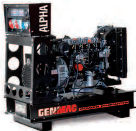
Изображение только для иллюстрации